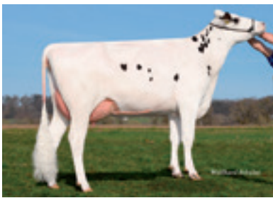
MR Puma Mutter CANDY