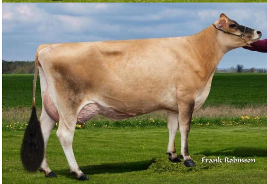
Rhuss - Mutter